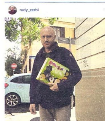
Place a 3.903 persone rudy_zerbi Help! Ditemi come si fa ad uscire dal tunnel di Masha e Orso.